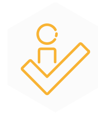
SORTIE VERS L'EMPLOI