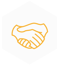
ACCUEIL & RECRUTEMENT

Partage 44 accueille et emploie des demandeurs d'emploi. Elle les accompagne dans leur parcours d'inclusion en mobilisant conjointement des missions de travail, l'accès à la formation et un accompagnement spécifique. Les formations proposées sont un levier crucial dans une démarche vers l'emploi pérenne et constituent une des forces de notre modus operandi.